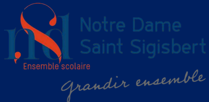
Notre Dame – Saint Sigisbert Nancy Lorraine