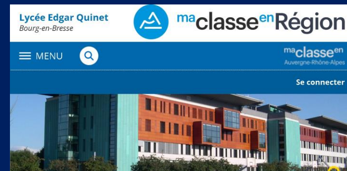
Lycée Edgar Quinet Bourg-en-Bresse Bresse