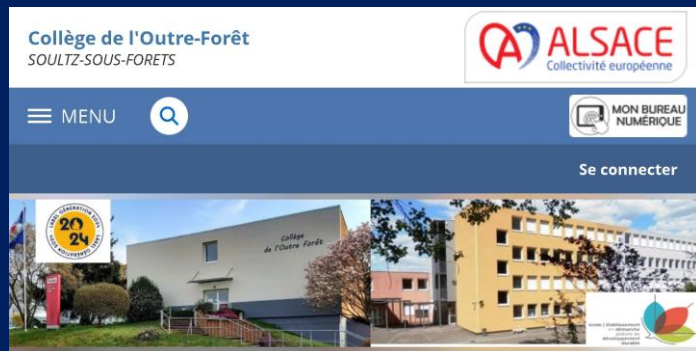
Collège de l'Outre-Forêt Soultz-Sous-Forêts Alsace