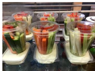
Gemüsesticks to go